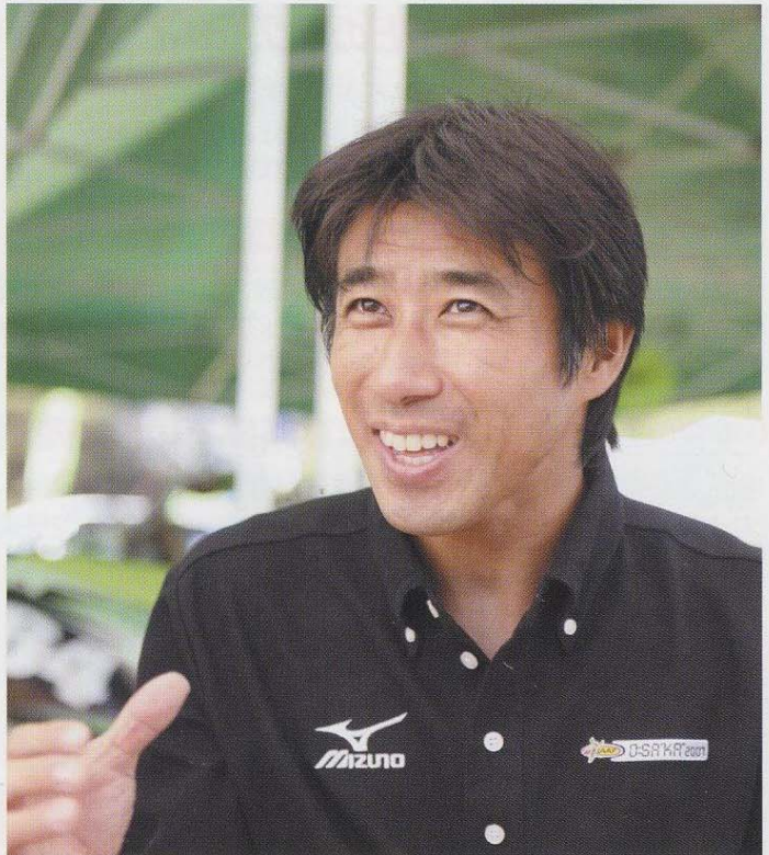
アサダ接骨院・鍼灸院 院長 有限会社 アサダコーポレーション 代表取締役 担当科目:保健体育